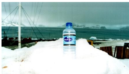
FIGURA 02 – Anúncio comercial de água mineral natural para consumo retirada do continente antártico.

Ainda que na forma de gelo, o potencial hídrico das calotas polares não pode ser de todo descartado. Mesmo que em pequena escala e com iniciativas frustradas, algumas nações cogitam rebocar icebergs do pólo sul e pólo norte com a finalidade de fornecer água potável para consumo em seus países. 8 Assim também no Brasil já é possível encontrar empresas engarrafadoras de água mineral organizando expedições à Antártida para avaliação da viabilidade hídrica.