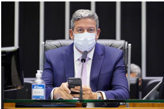
Arthur Lira, presidente da Câmara dos Deputados.

A reforma administrativa foi enviada pelo governo ao Congresso em setembro de 2020. A proposta tem como objetivo alterar as regras para os futuros servidores dos poderes Executivo, Legislativo e Judiciário da União, Estados e municípios. Ou seja, as mudanças propostas pelo governo não atingem os atuais servidores e mesmo aqueles que entrarem no serviço público antes da aprovação da reforma. Também não altera a estabilidade nem os vencimentos desses servidores.