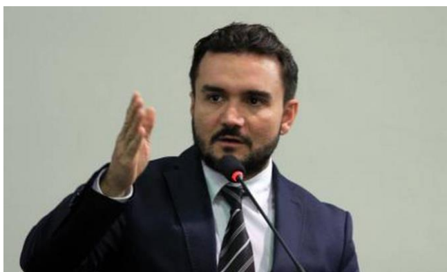
Deputado Celso Sabino, do PSDB do Pará

BRASÍLIA – O deputado Celso Sabino (PSDB-PA) apresentou novo substitutivo da reforma tributária nesta terça-feira. Uma mudança é a proposta de aumento da alíquota do CFEM, compensação financeira pela exploração de recursos minerais, paga por mineradoras, cuja arrecadação seria integralmente repassada para estados e municípios.