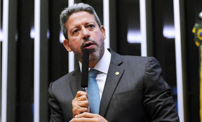
Presidente da Câmara, deputado Arthur Lira

— Esperamos ter acesso ao texto do relator até o fim deste mês, no plenário. Temos a obrigação de entregar as matérias estruturantes para o nosso país até novembro, dada a proximidade das eleições —disse o presidente da Câmara, durante debate virtual sobre o assunto, referindo-se, além da reforma administrativa, às reformas tributária e política.