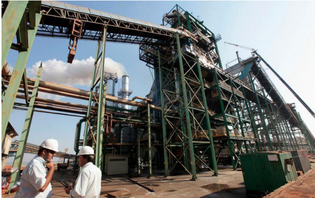
Usina de processamento de cana-de-açúcar em Valparaíso (SP)

SÃO PAULO (Reuters) – As usinas termelétricas à biomassa poderão ofertar geração adicional de energia ao Operador Nacional do Sistema Elétrico (ONS) a partir de quarta-feira, em medida que visa contribuir com o fornecimento de eletricidade em meio à grave crise hídrica enfrentada pelo Brasil, disse a União da Indústria de Cana-de-Açúcar (Unica) nesta terça-feira.