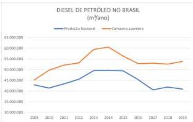
https://846928.smushcdn.com/1787860/wp-content/uploads/2021/02/Imagem2-1536x959.png?lossy=1&strip=1&webp=1 Figura 2 – Consumo e produção de diesel no Brasil 2009-2019 (Fonte: elaboração própria com dados ANP, 2020)

A produção total de diesel no país foi inferior ao seu consumo aparente na última década, conforme é demonstrado no gráfico da figura 2 a seguir, utilizando dados publicados pela Agência Nacional do Petróleo (ANP). Importante frisar que desconsidera-se aqui o volume de biodiesel utilizado no país.,